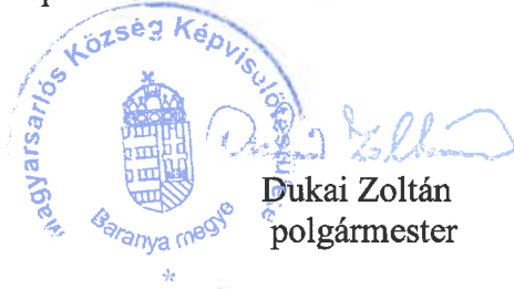
Dukai Zoltán polgármester

A képviselő-testület rendeletét a 2024. szeptember 05-én tartott ülésén fogadta el.